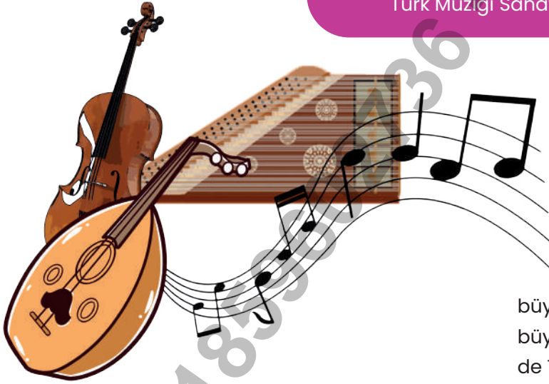
Melihat Gülses Türk Müziği Sanatkârı